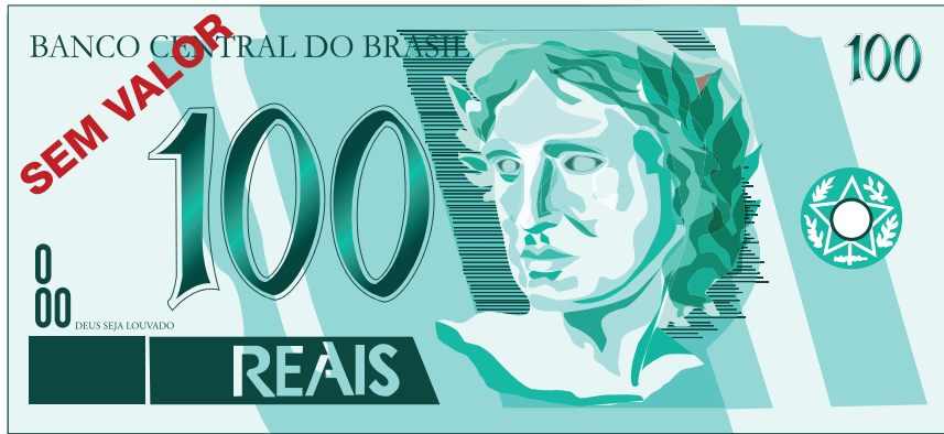
Centena: Nota de 100 reais